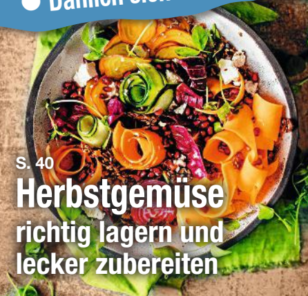
S. 40 Herbstgemüse richtig lagern und lecker zubereiten