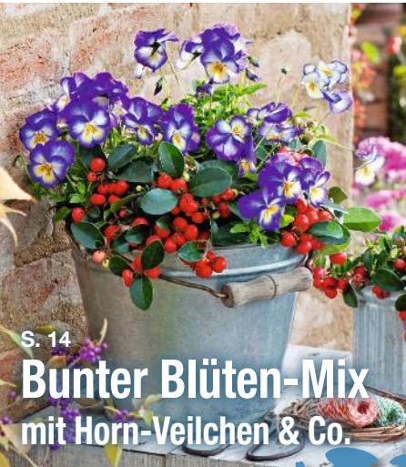
S. 14 Bunter Blüten-Mix mit Horn-Veilchen & Co.

Mit vielen Schritt für Schritt Anleitungen