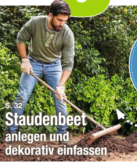
S. 32 Staudenbeet anlegen und dekorativ einfassen

Mit vielen Schritt für Schritt Anleitungen