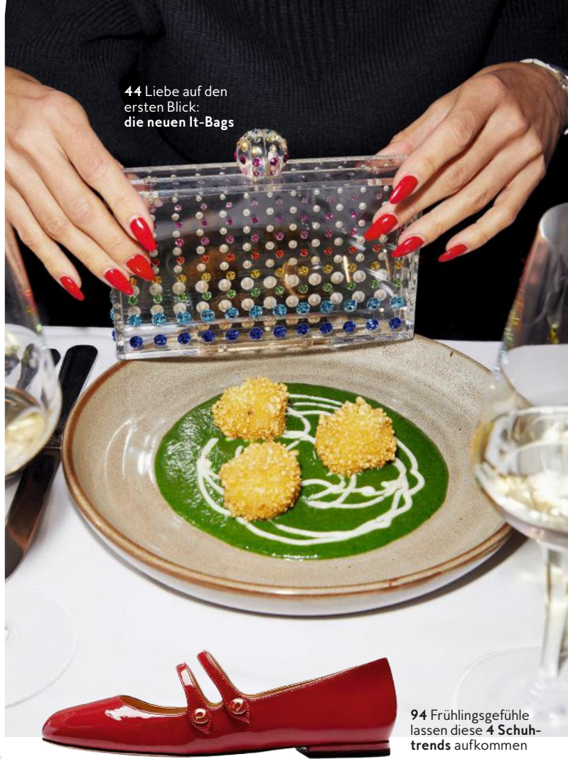
44 Liebe auf den ersten Blick: die neuen It-Bags