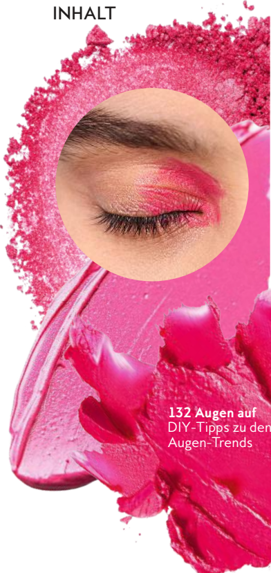
132 Augen auf DIY-Tipps zu den Augen-Trends