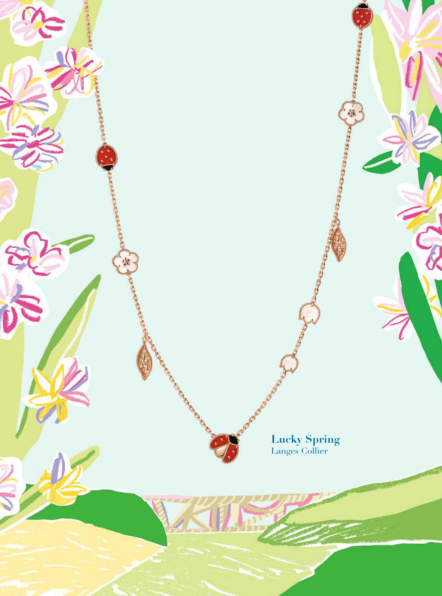
Lucky Spring Langes Collier