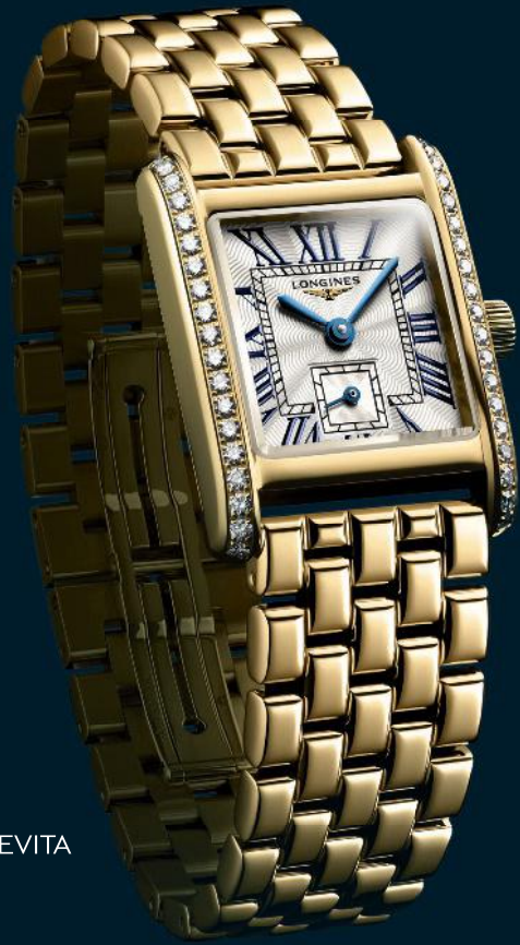
LONGINES MINI DOLCEVITA