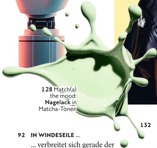
128 Match(a) the mood: Nagelack in Matcha-Tönen