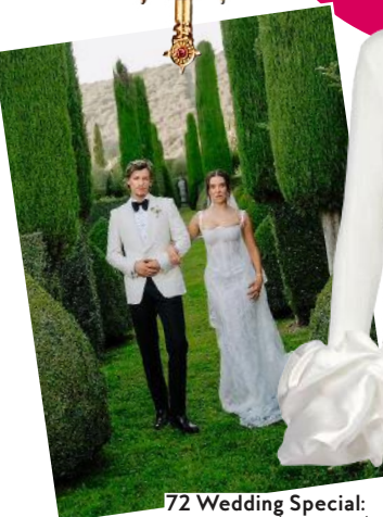
72 Wedding Special: so vielfältig (und chic!) ist Hochzeitsmode heute