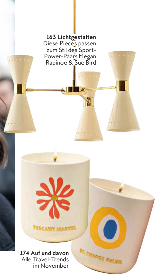
163 Lichtgestalten Diese Pieces passen zum Stil des Sport- Power-Paars Megan Rapinoe & Sue Bird