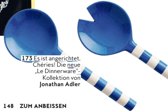
173 Es ist angerichtet, Chéries! Die neue „Le Dinnerware“-Kollektion von Jonathan Adler