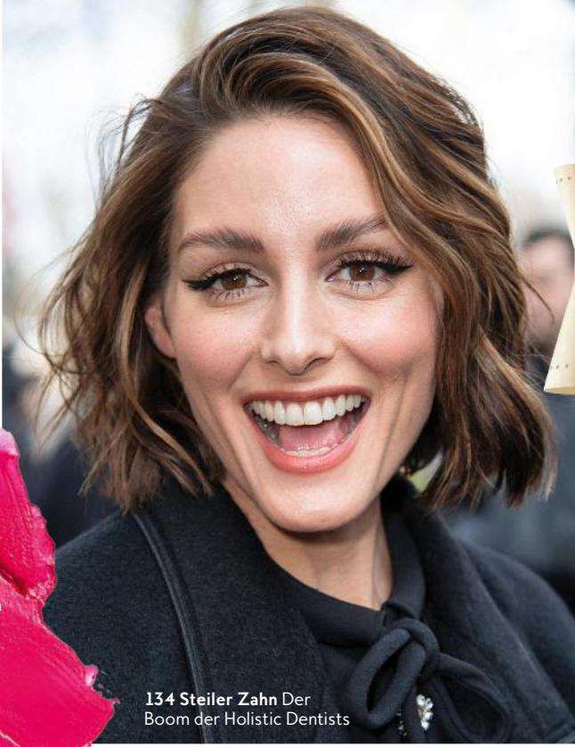
134 Steiler Zahn Der Boom der Holistic Dentists