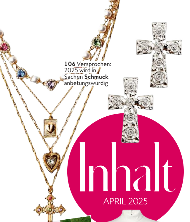
106 Versprochen: 2025 wird in Sachen Schmuck anbetungswürdig