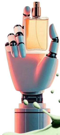
120 Geist in der Flasche: KI in der Parfumbranche