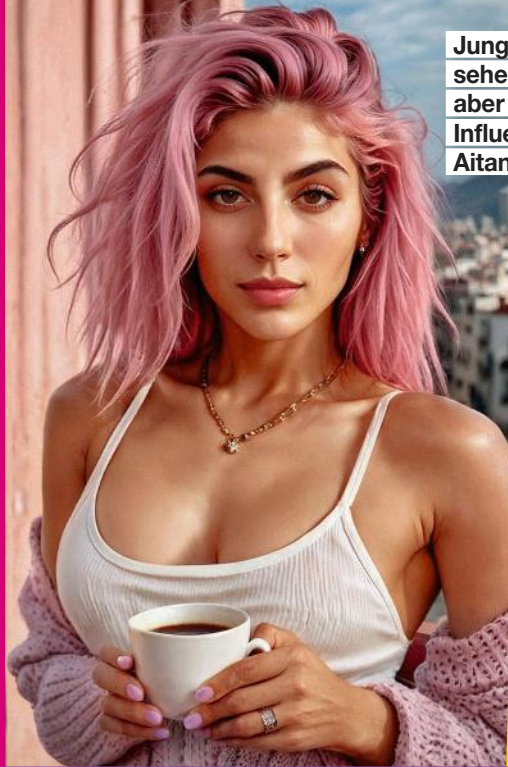
Jung, gut aussehend, beliebt, aber nicht echt: Influencerin Aitana Lopez