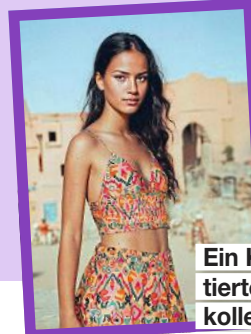
Ein KI-Model präsentierte die Sommerkollektion der Mode-Kette Mango

von KI-Projekten wie diesen? Schreiben Sie uns an redaktion@lisa.de