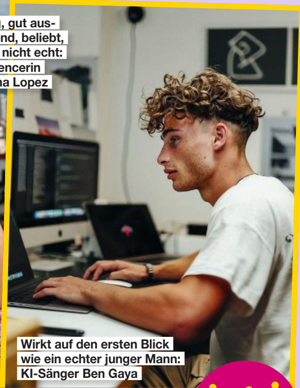
Wirkt auf den ersten Blick wie ein echter junger Mann: KI-Sänger Ben Gaya