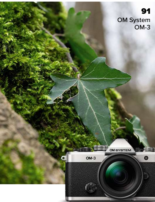
91 OM System OM-3