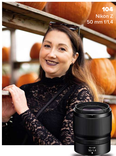
104 Nikon Z 50 mm f/1,4