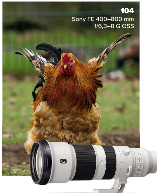
104 Sony FE 400-800 mm f/6,3-8 G OSS