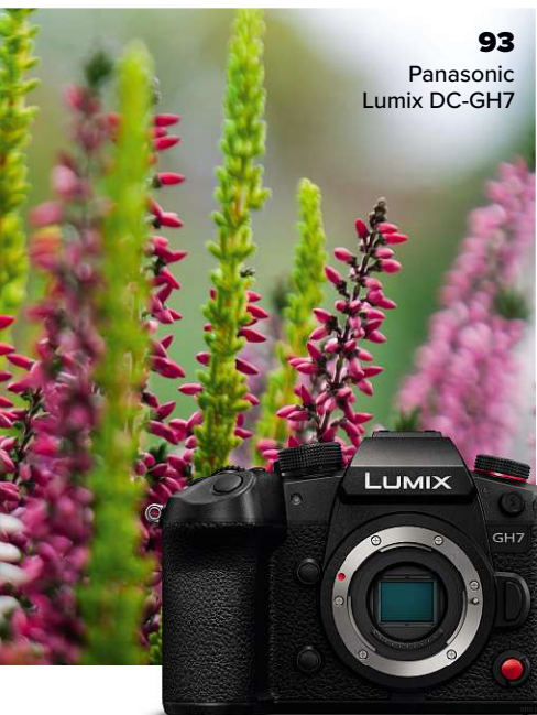
93 Panasonic Lumix DC-GH7