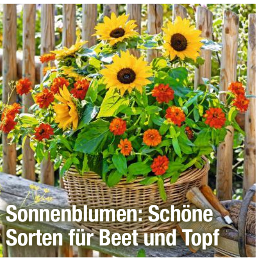
Sonnenblumen: Schöne Sorten für Beet und Topf