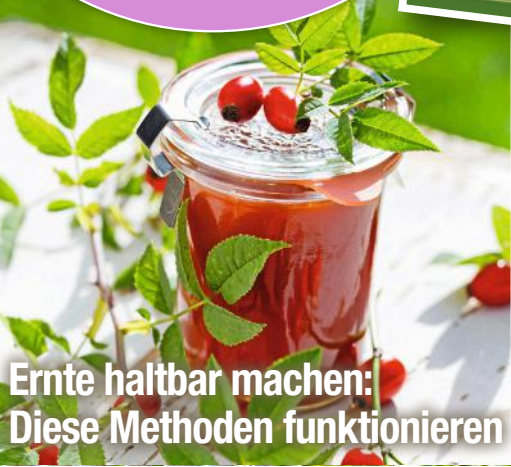
Ernte haltbar machen: Diese Methoden funktionieren