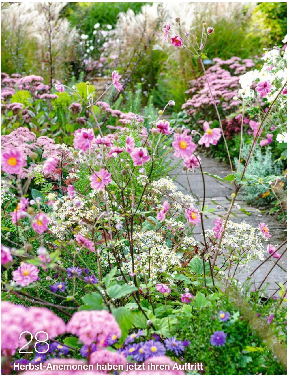
Herbst-Anemonen haben jetzt ihren Auftritt