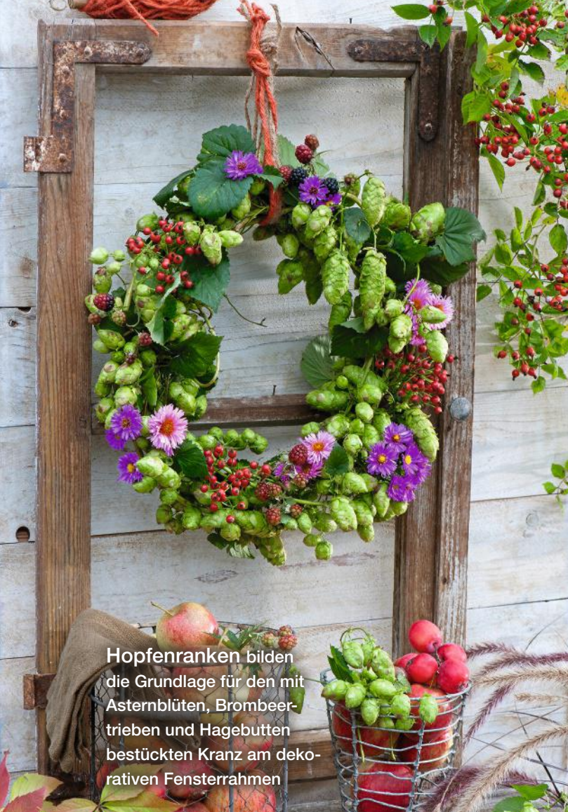
Hopfenranken bilden die Grundlage für den mit Asternblüten, Brombeertrieben und Hagebutten bestückten Kranz am dekorativen Fensterrahmen