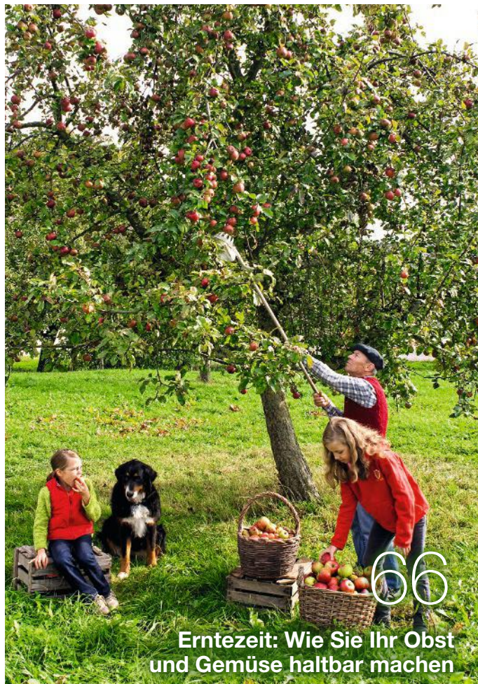
Erntezeit: Wie Sie Ihr Obst und Gemüse haltbar machen