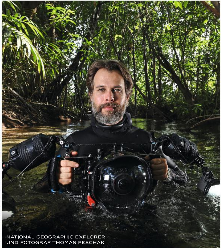
NATIONAL GEOGRAPHIC EXPLORER UND FOTOGRAF THOMAS PESCHAK