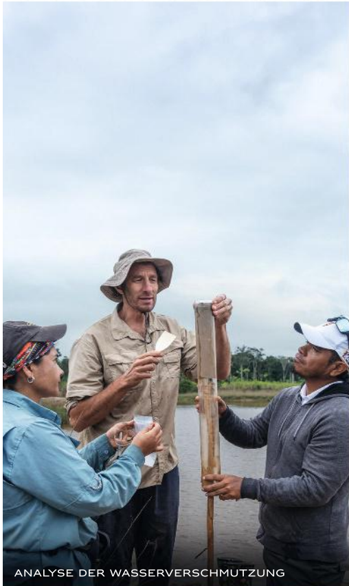
ANALYSE DER WASSERVERSCHMUTZUNG