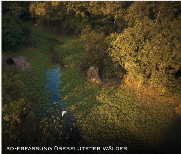
3D-ERFASSUNG ÜBERFLUTETER WÄLDER