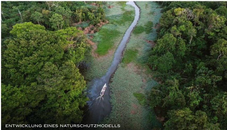
ENTWICKLUNG EINES NATURSCHUTZMODELLS