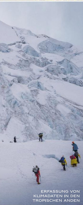
ERFASSUNG VON KLIMADATEN IN DEN TROPISCHEN ANDEN