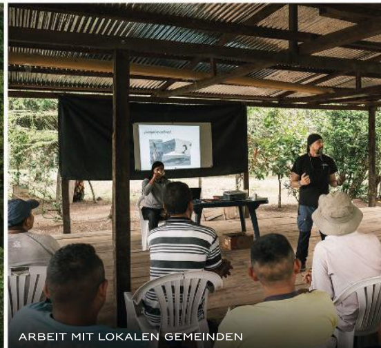
ARBEIT MIT LOKALEN GEMEINDEN