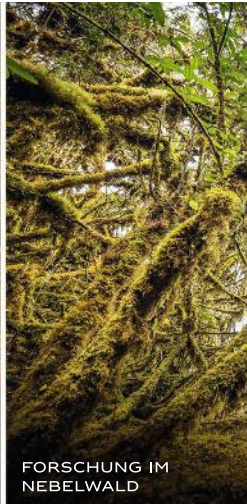
FORSCHUNG IM NEBELWALD