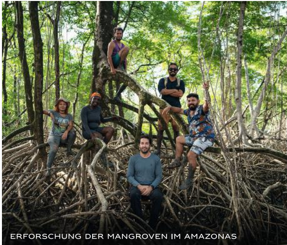
ERFORSCHUNG DER MANGROVEN IM AMAZONAS