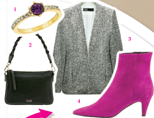
Abendtauglich mit Glitzer-Blazer