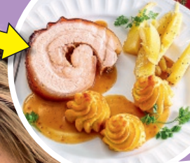
Z.B. Rollbraten mit feiner Honig-Glasur