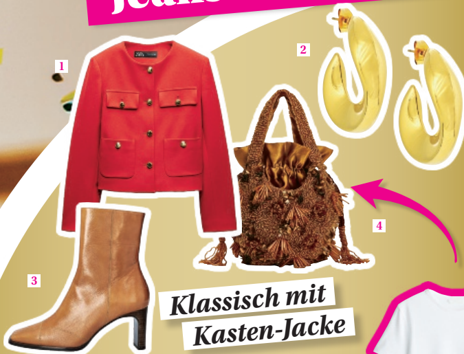
Klassisch mit Kasten-Jacke