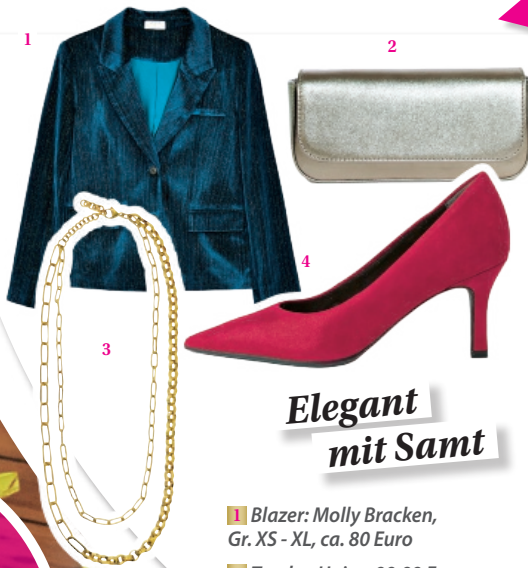
Elegant mit Samt

Damit wird jedes Styling zum glamourösen Hingucker. Das Pailletten-Shirt sitzt dabei auch noch so bequem! Next, je Gr. 34 - 50, Shirt 65 Euro, Jeans 40 Euro