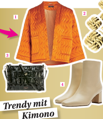
Trendy mit Kimono