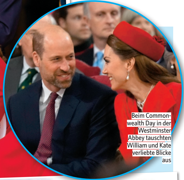
Beim Commonwealth Day in der Westminster Abbey tauschten William und Kate verliebte Blicke aus