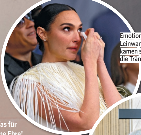
Emotional: Dem Leinwandstar kamen schnell die Tränen