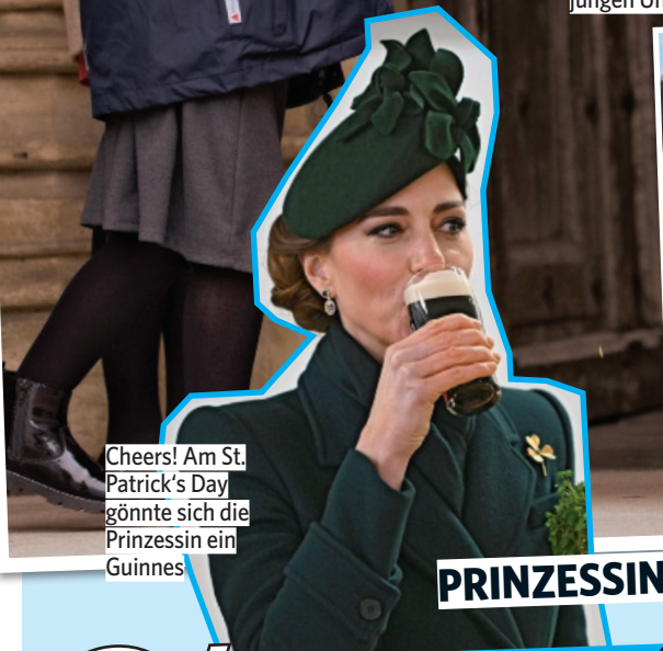
Cheers! Am St. Patrick's Day gönnte sich die Prinzessin ein Guinness