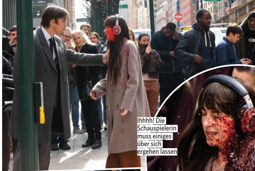
Ihyyy! Die Schauspielerin muss einiges über sich ergehen lassen