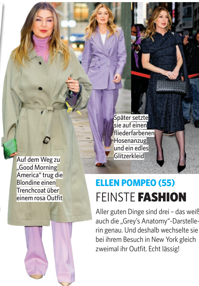
Auf dem Weg zu „Good Morning America“ trug die Blondine einen Trenchcoat über einem rosa Outfit