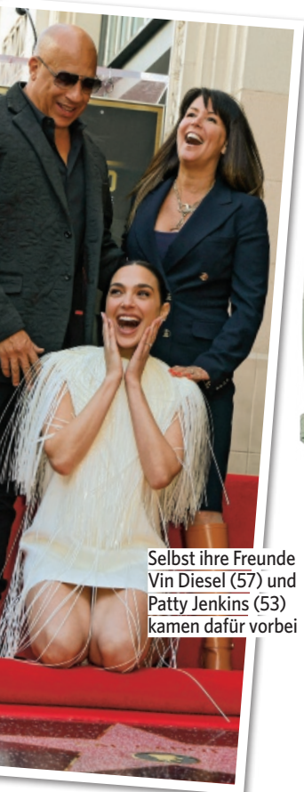
Selbst ihre Freunde Vin Diesel (57) und Patty Jenkins (53) kamen dafür vorbei

Erst vor wenigen Wochen ist das brasilianische Supermodel zum dritten Mal Mutter geworden und genießt seitdem das Familienglück ganz privat. Doch jetzt wagte sich Gisele mit ihrem Baby für einen Spaziergang mit Hund „Alfie“ an die Öffentlichkeit und zeigt, wie fit sie schon wieder ist.