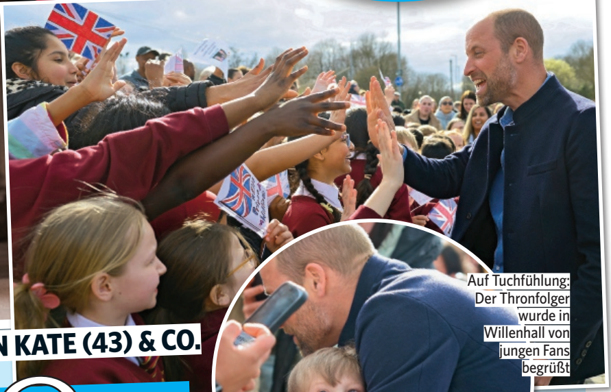
Auf Tuchfühlung: Der Thronfolger wurde in Willenhall von jungen Fans begrüßt