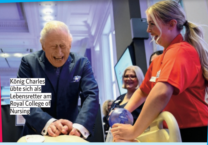
König Charles übte sich als Lebensretter am Royal College of Nursing

Die britischen Royals haben sich mal wieder mächtig ins Zeug gelegt: Während Prinzessin Kate und Prinz William (42) Kinder und Tiere glücklich machten, durfte Charles III. (76) seine Erste-Hilfe-Kenntnisse unter Beweis stellen. Ob der König im Ernstfall etwas taugt? Spaß hatte er definitiv