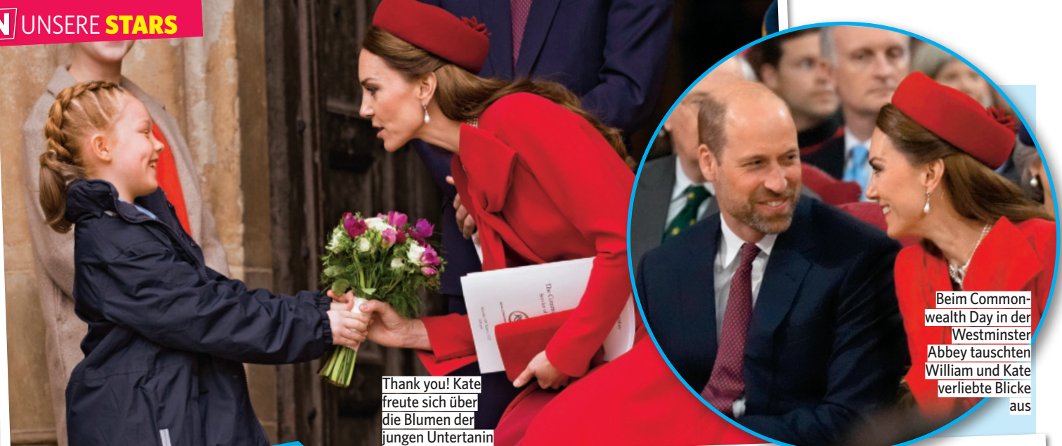
Thank you! Kate freute sich über die Blumen der jungen Untertanin