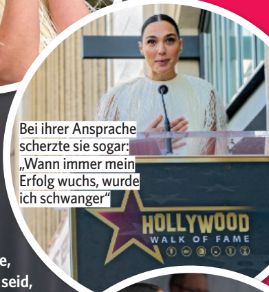
Bei ihrer Ansprache scherzte sie sogar: „Wann immer mein Erfolg wuchs, wurde ich schwanger“