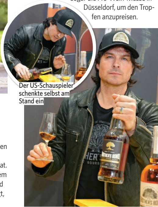
Der US-Schauspieler schenkte selbst am Stand ein

Nachdem sich schon einige Kollegen einen Namen in der Welt der Spirituosen gemacht haben, ist auch der „Vampire Diaries“-Star nachgezogen. Mit seinem eigenen Bourbon Whiskey von Brothers Bond besuchte Ian nun sogar die Pro-Wein-Messe in Düsseldorf, um den Tropfen anzupreisen.