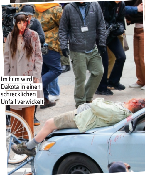
Im Film wird Dakota in einen schrecklichen Unfall verwickelt