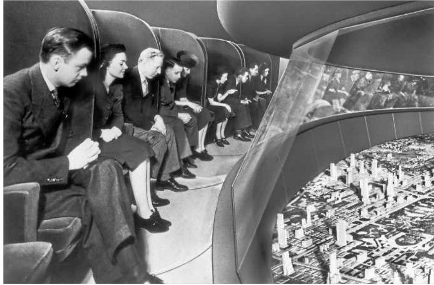
Szenerie künftiger Lebenswelt bei der Weltausstellung in New York 1939: Projektionsfläche für Ideen aller Art

Wie haben sich die Menschen früher eigentlich die Zukunft vorgestellt? Das ist die Frage, die über diesem Heft steht. Und um gleich darauf einzustimmen, haben wir für unser Titelbild eine heutige Zukunftstechnologie mit dieser Frage gefüttert: Der Bildgenerator Midjourney, ein Programm, das mit künstlicher Intelligenz (KI) arbeitet, hat darauf die Antwort gegeben, die Sie auf dem Titel sehen.