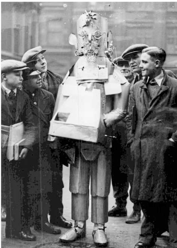
Technisch Menschenmaschinen waren seit Jahrhunderten ein Traum – und dann plötzlich Anlass zur Sorge. Seite 104