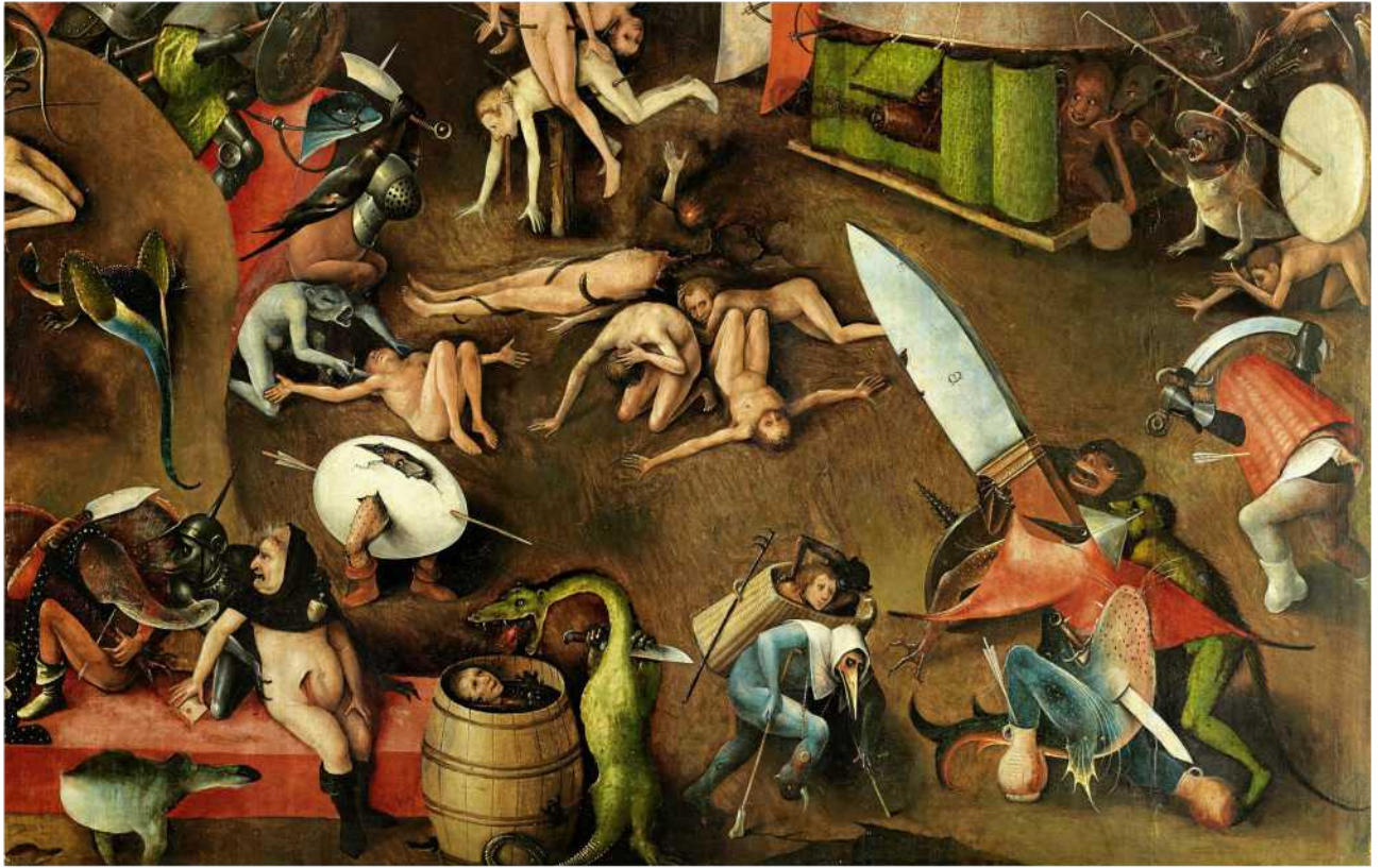
Religiös Eine biblische Prophezeiung beeinflusst die US-Politik. Seite 52