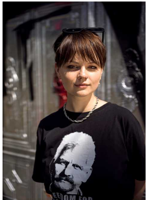
Politisch Welche Visionen haben junge Menschen heute? Seite 134