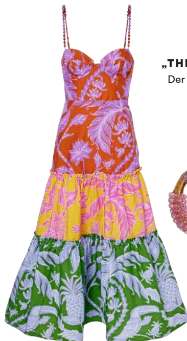
„THE WHITE LOTUS“ Der Look zu dem TV-Hit S. 50