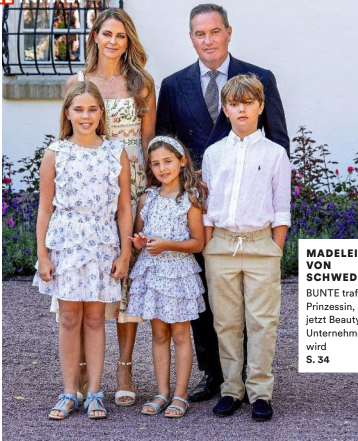
MADELEINE VON SCHWEDEN BUNTE traf die Prinzessin, die jetzt Beauty-Unternehmerin wird S. 34