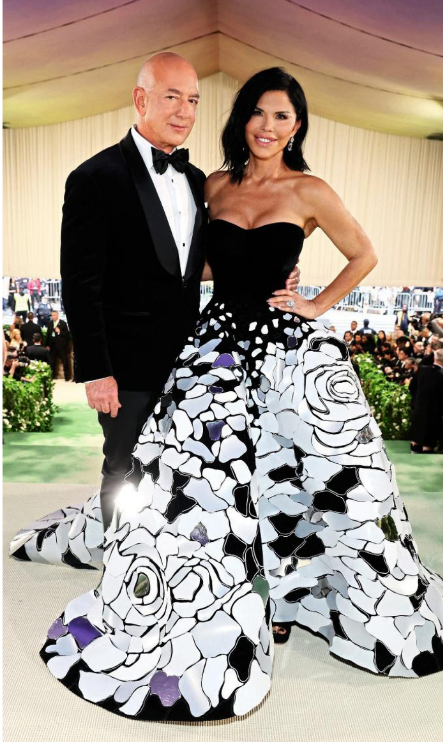
JEFF BEZOS & LAUREN SÁNCHEZ

Der Amazon-Milliardär heiratet seine Verlobte in Venedig – geplant ist ein Fest voller Luxus S. 22