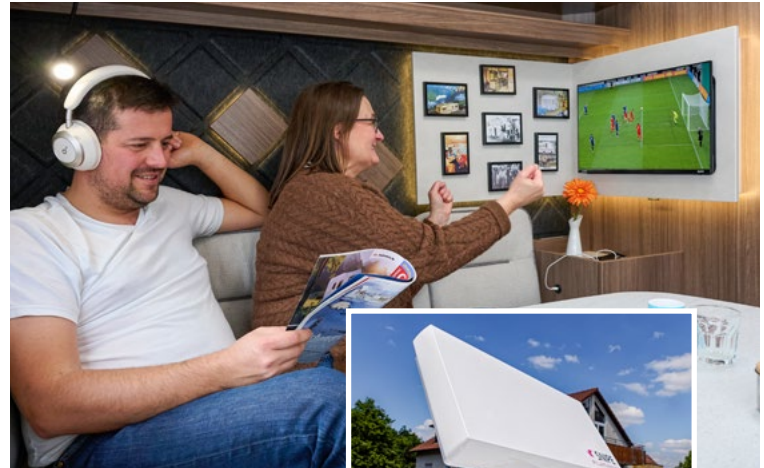
Die ARD-Programme sind über Satellit nur noch in HD-Qualität zu empfangen. Manche Caravaner müssen deshalb umrüsten.

Möglichkeiten zum Umrüsten: zum einen mit einem neuen, HD-fähigen Fernseher, bei dem der dafür notwendige DVB-S2-Tuner bereits integriert ist. Die kostengünstigere Alternative ist die Anschaffung eines externen DVB-S2-Receivers. Der kostet meist zwischen 30 und 50 Euro und wird mit dem vorhandenen Fernseher verbunden. Wer sich für diese Möglichkeit entscheidet, der sollte darauf achten, dass die Anschlüsse von Fernseher und Receiver zueinander passen. Übrigens: Beim ZDF und seinen Spartensendern ZDFinfo, ZDFneo, 3Sat und KiKA erfolgt die SD-Abschaltung am 18. November 2025.