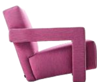
Pretty in Pink: Sessel „Utrecht“ (Bezug: Uni Melange Coral) von CASSINA, um 4430 €