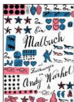
Kreative-Pause: Malbuch mit Zeichnungen von Andy Warhol, DEUTSCHER KUNSTVERLAG, 12,80 €