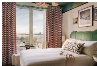
Zeitreise: THE HOXTON in Wien verbindet Retro-Chic mit Neuzeit-Komfort! DZ ab 120 €, thehoxton.com