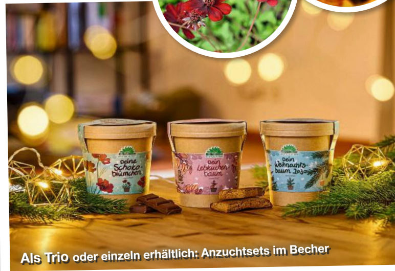
Als Trio oder einzeln erhältlich: Anzuchtsets im Becher