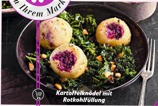
Kartoffelknödel mit Rotkohlfüllung