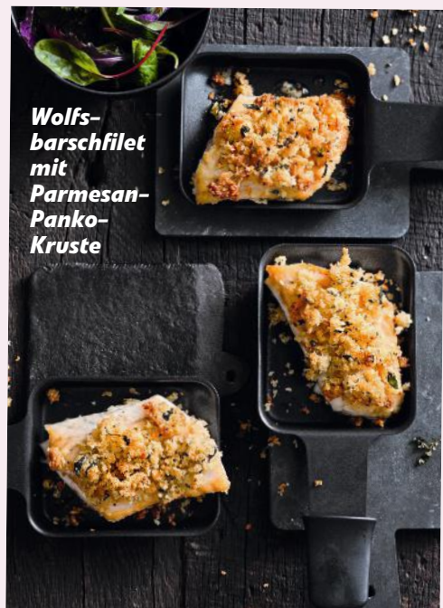
Wolfsbarschfilet mit Parmesan-Panko-Kruste

Raffinierte Rezepte & kreative Ideen für den Weg durch Ihren EDEKA-Markt