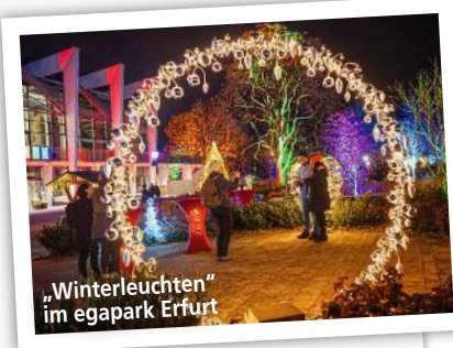
Angaben ohne Gewähr. Bitte informieren Sie sich vor dem Besuch über aktuelle Öffnungszeiten

Am 30.11. und 1.12. findet an Kloster und Schloss der Salemer Weihnachtsmarkt statt. Kunstbegeisterte können an Führungen durch Münster und Kloster teilnehmen. salem.de