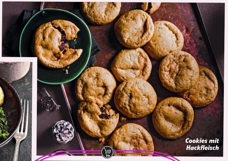
Cookies mit Hackfleisch