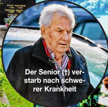
Der Senior (†) verstarb nach schwerer Krankheit

Das Grab der Großeltern des Schauspielers in Rottenmann