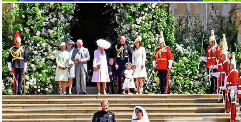
Die Hochzeit 2018 war ein weltweit übertragenes Spektakel