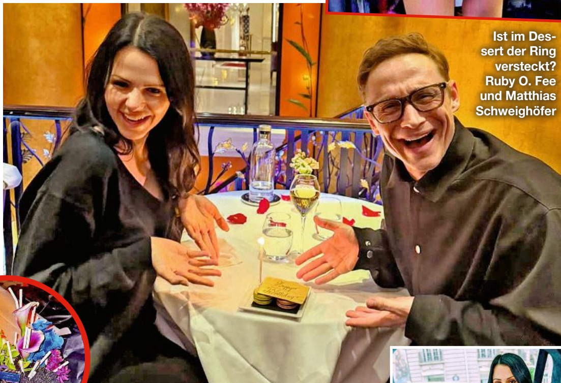
Ist im Dessert der Ring versteckt? Ruby O. Fee und Matthias Schweighöfer

Die Schauspielerin trägt gerade gern brautähnliche Outfits, wie man sieht