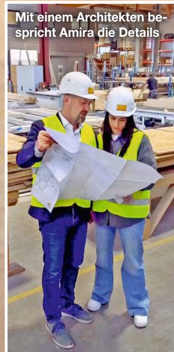
Mit einem Architekten spricht Amira die Details