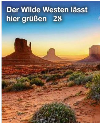
Der Wilde Westen lässt hier grüßen 28