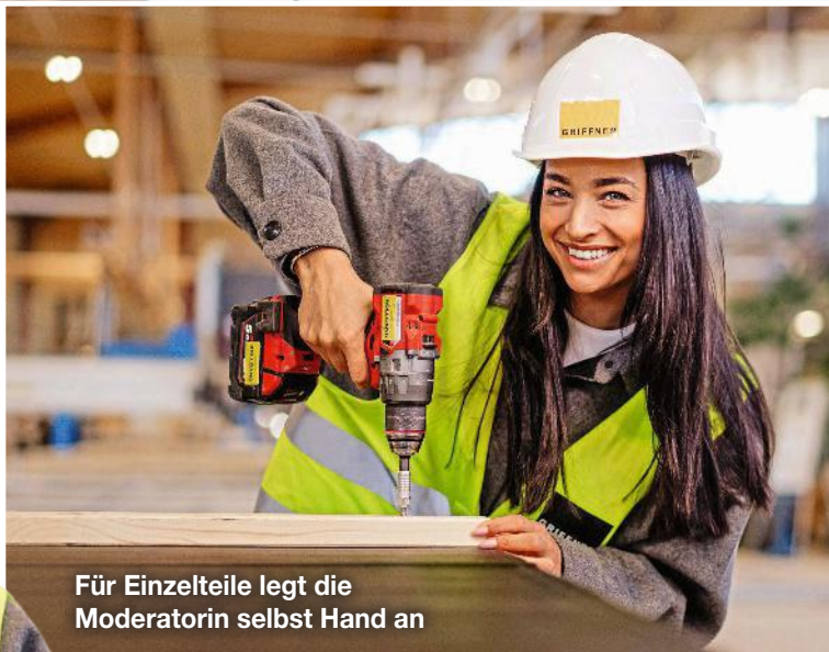
Für Einzelteile legt die Moderatorin selbst Hand an