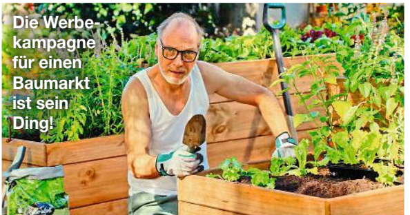
Die Werbekampagne für einen Baumarkt ist sein Ding!