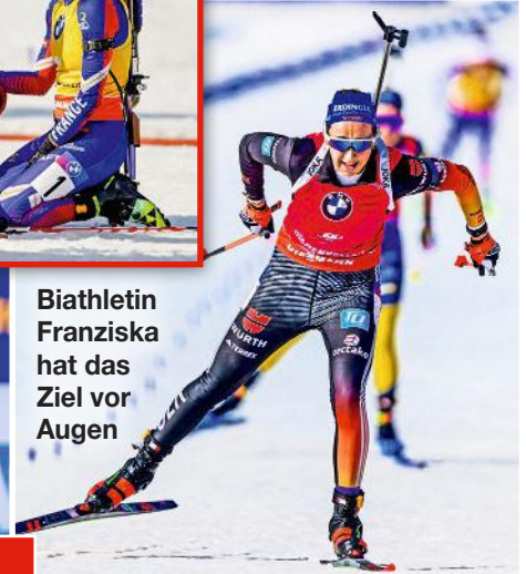
Biathletin Franziska hat das Ziel vor Augen