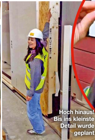
Hoch hinaus! Bis ins kleinste Detail wurde geplant