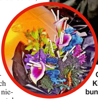
Calla-Lilien und Kippen! Ihr bunter Strauß