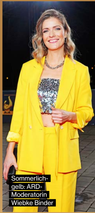
Sommerlich-gelb: ARD-Moderatorin Wiebke Binder