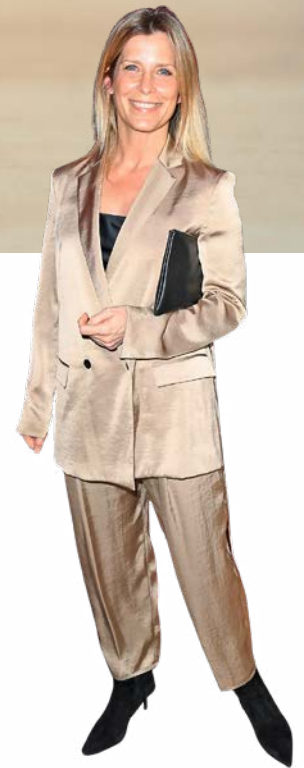
Schauspielerin und Moderatorin Valerie Niehaus beim Deutschen Hörfilmpreis (S. 88)