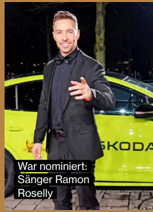
War nominiert: Sänger Ramon Roselly