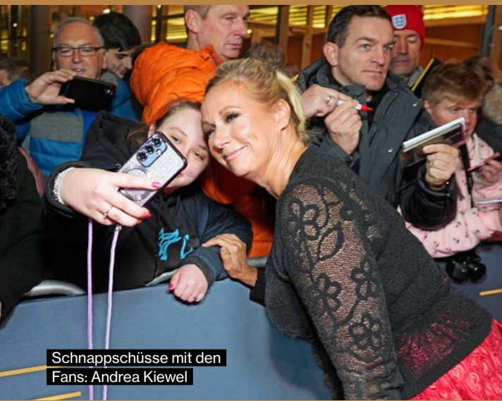
Schnappschüsse mit den Fans: Andrea Kiewel