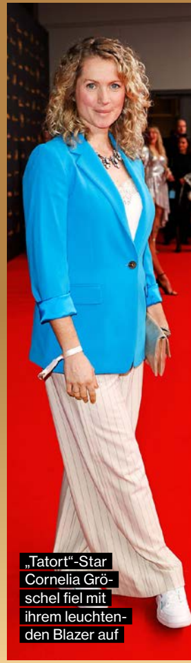
„Tatort“-Star Cornelia Gröschel fiel mit ihrem leuchten- den Blazer auf