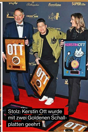
Stolz: Kerstin Ott wurde mit zwei Goldenen Schallplatten geehrt