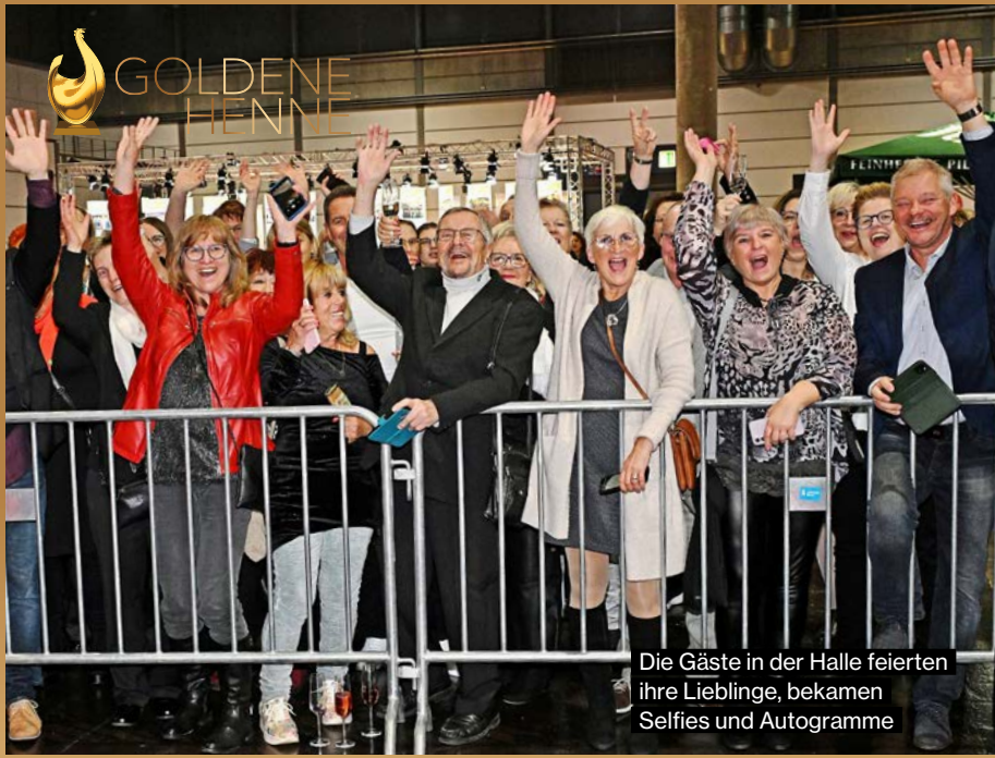
Die Gäste in der Halle feierten ihre Lieblinge, bekamen Selfies und Autogramme