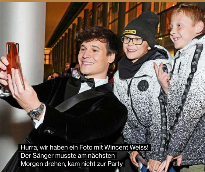
Hurra, wir haben ein Foto mit Wincent Weiss! Der Sänger musste am nächsten Morgen drehen, kam nicht zur Party