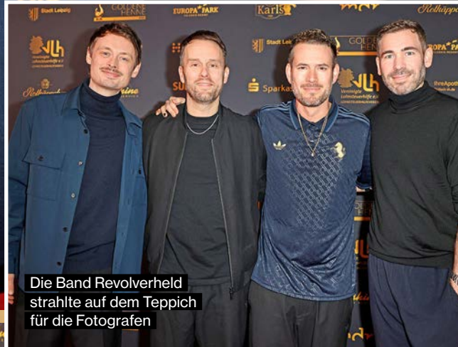
Die Band Revolverheld strahlte auf dem Teppich für die Fotografen