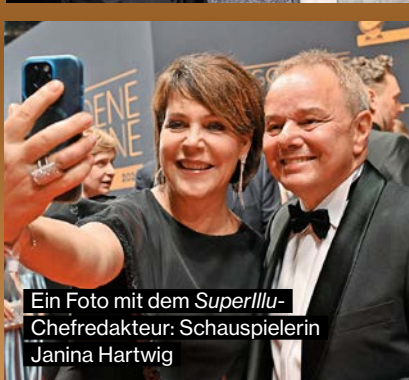
Ein Foto mit dem SuperIllu-Chefredakteur: Schauspielerin Janina Hartwig