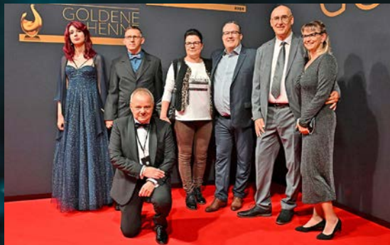
Sechs von vielen glücklichen Gewinnern der Henne-Karten durfte ich persönlich am roten Teppich begrüßen