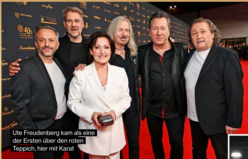
Ute Freudenberg kam als eine der Ersten über den roten Teppich, hier mit Karat