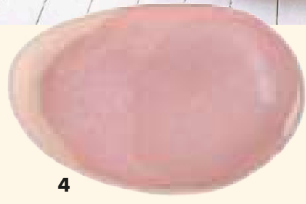
1 Modernes It-Piece: Vase „Crackle“, H 12,1 cm, Glas, ca. 80 Euro (Kosta Boda über Royal Design) 2 Traditionelles Muster: Geschirrtuch „Calla Azur“, ca. 16 Euro (Bungalow) 3 Glamouröser Touch: goldener Serviettenhalter „Hold Me Tight“, ca. 15 Euro (Butlers über Otto.de) 4 Organische Form: ovaler Servierteller „Wabi rosa“, Keramik, 36 x 25 cm, ca. 65 Euro (Jars)