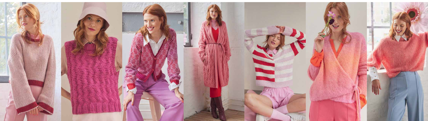
15 ●●●●○ 16 ●●●●○ 17 ●●●●○ 18 ●●●●○ 19 ●●●●○ 20 ●●●●○ 21 ●●●●○