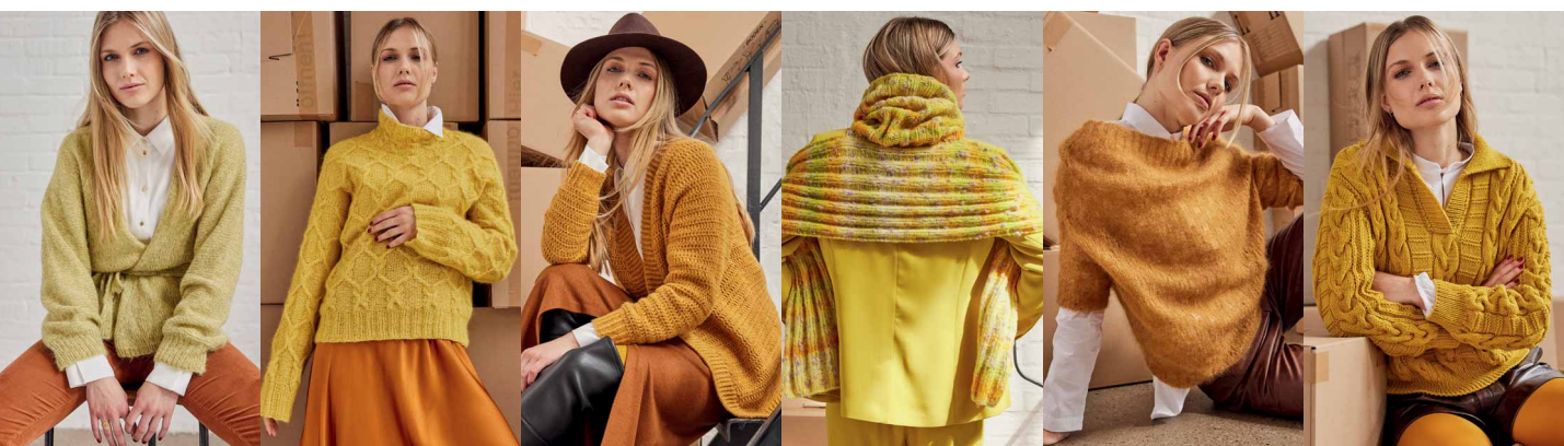
29 ●●○○○ 30 ●●●○○ 31 ●●○○○ 33 ●○○○○ 34 ●●●○○ 35 ●●●●●