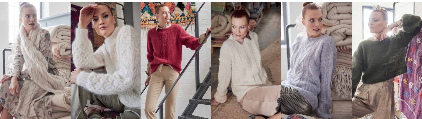
52 ●●●●○ 53 ●●●●○ 54 ●●●●○ 55 ●●●●○ 56 ●●●●○ 57 ●●●●○