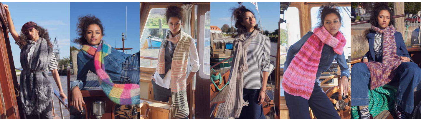
29 ●●●●○ 30 ●●●●○ 31 ●●●●○ 32 ●●●●○ 32 ●●●●○ 33 ●●●●○