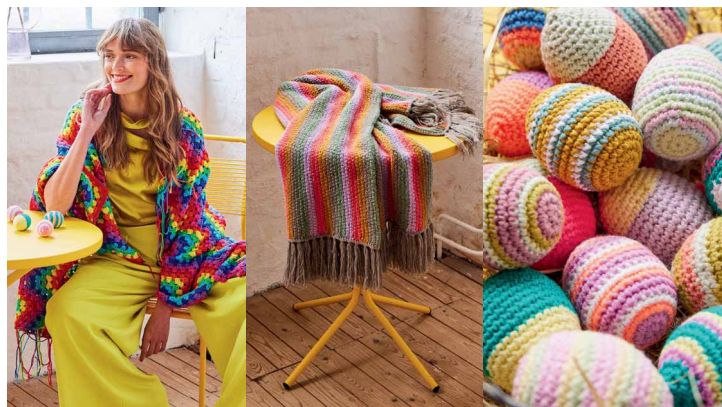
45 ●●●●○ 46 ●●●●○ 46 ●●●●○