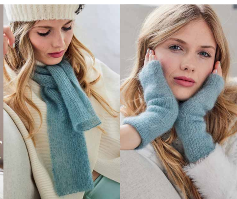
46 ●○○○○ 46 ●○○○○