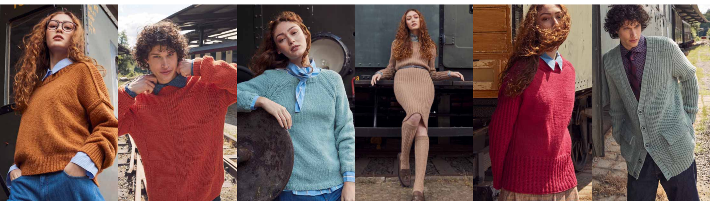
54 ●●○○○ 55 ●●●○○ 56 ●●○○○ 57 ●●●○○ 58 ●●●○○ 58 ●●●○○