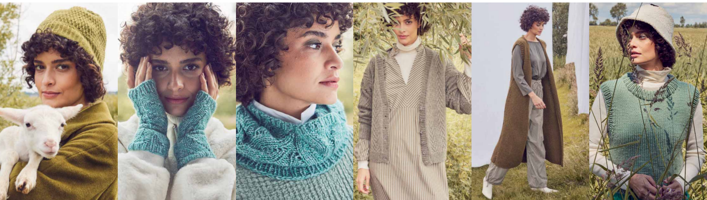
13 ●●○○○ 14 ●●○○○ 14 ●●○○○ 15 ●●●○○ 16 ●●○○○ 16 ●●○○○