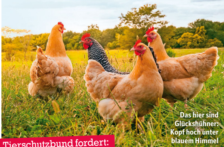
Das hier sind Glückshühner: Kopf hoch unter blauem Himmel