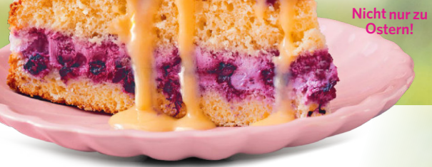
Nicht nur zu Ostern!

Himmlische Eierlikör-Kuchen Mit Schwips, Schmelz, und Beeren s.50