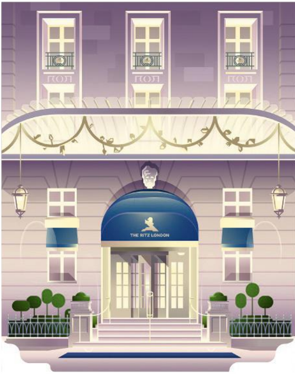
The Ritz London

CHAMPAGNE Laurent-Perrier MAISON FONDÉE 1812