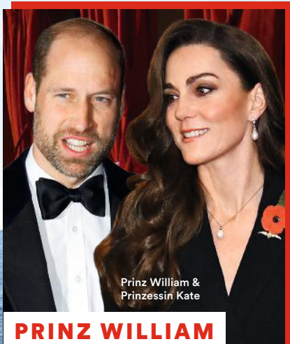
Prinz William & Prinzessin Kate

MELANIA TRUMP Darum will sie nicht ins Weiße Haus