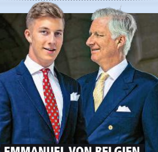
EMMANUEL VON BELGIEN