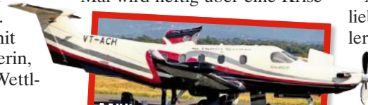
Müllers neuer Privatjet. Preis: etwa 2,4 Millionen

kam“ in Bayern, züchtet dort edle Pferde. Jetzt die neue, sehr kostspielige Passion. Hat Müller damit seine Ehe gerettet? Seit Mai wird heftig über eine Krise