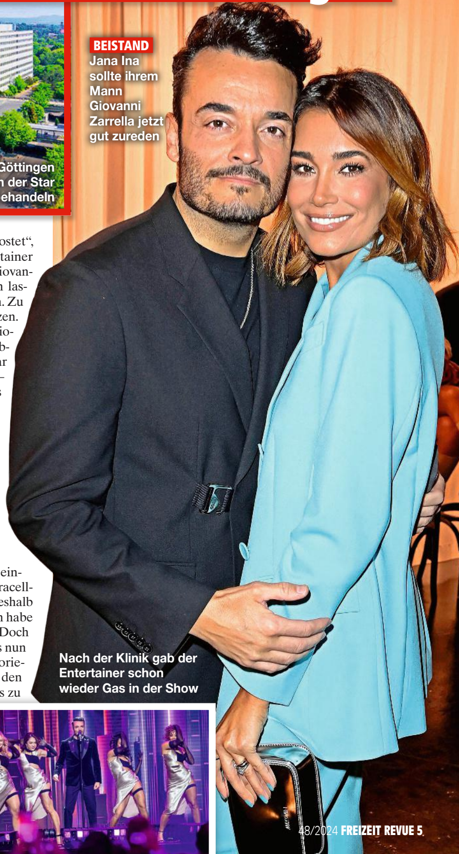
Nach der Klinik gab der Entertainer schon wieder Gas in der Show

Jana Ina sollte ihrem Mann Giovanni Zarrella jetzt gut zureden