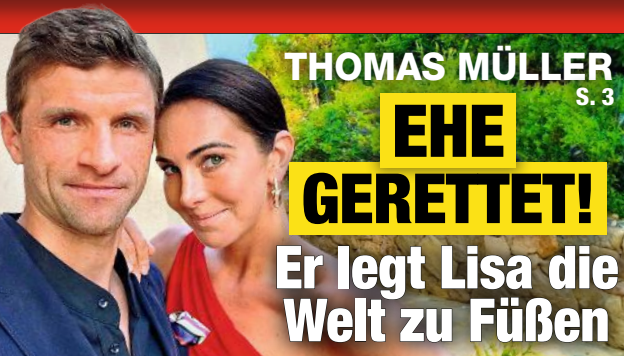
THOMAS MÜLLER S. 3