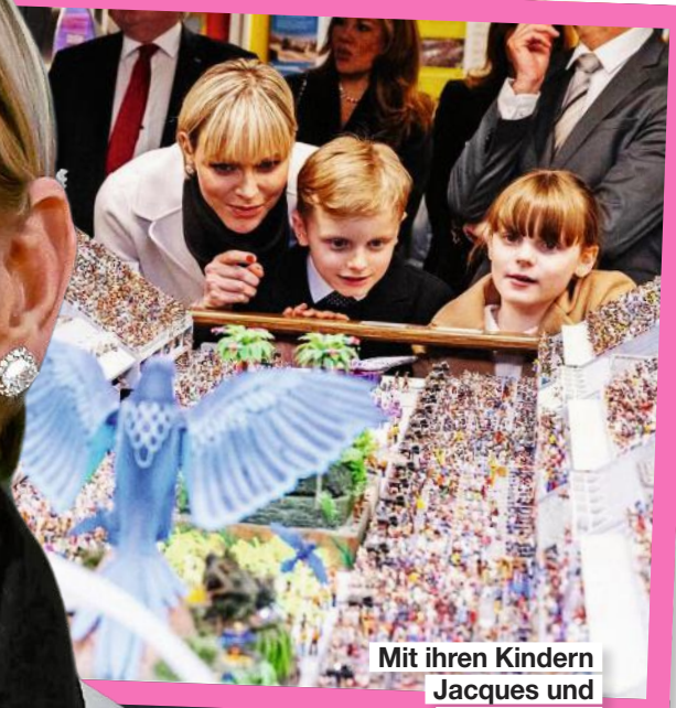
Mit ihren Kindern Jacques und Gabriella im Miniatur Wunderland in Hamburg

Viele süße Details, doch über Ehemann Albert verliert Charlene kaum ein Wort. Kriselt es bei da etwa wieder? Dass nicht immer alles eitel Sonnenschein sei, gab der Monarch im Magazin „Paris Match“ zu. Mit welcher Sportart er seine Ehe vergleichen würde? Albert: „Vielleicht mit einem Staffellauf. Ein ständiger Kampf und vor allem eine große gegenseitige Unterstützung.“ Die hoffentlich nicht plötzlich endet.