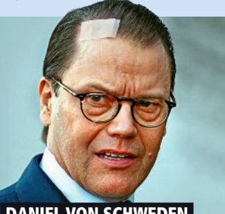
DANIEL VON SCHWEDEN

■ Der Sohn von Belgiens König Philippe (64) liebt Fußball. Jetzt studiert Emmanuel (19) an einer Sportakademie in Spanien und strebt eine Profikarriere an – er wäre der erste royale Spieler!