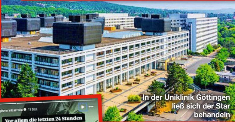
In der Uniklinik Göttingen ließ sich der Star behandeln