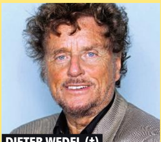
DIETER WEDEL (†)