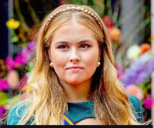
AMALIA DER NIEDERLANDE