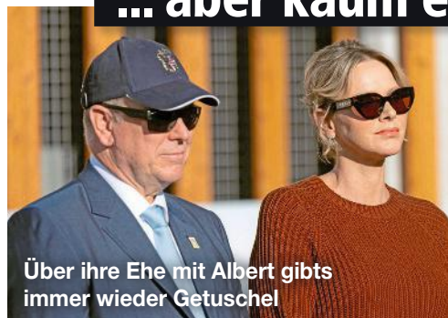
Über ihre Ehe mit Albert gibts immer wieder Getuschel

D ie Zeiten, die hinter Fürstin Charlene (46) und Ehemann Albert (66) liegen, waren hart. Sogar über ein Ehe-Aus wurde immer wieder in Monaco getuschelt. Doch dann ging es wieder bergauf: Charlene kehrte nach ihrer langen Erkrankung zu Albert und ihren Zwillingen Jacques und Gabriella (werden im Dezember 10) zurück. Alles schien in bester Ordnung. Doch nun gab die Fürstin ein Interview, das aufhorchen lässt.